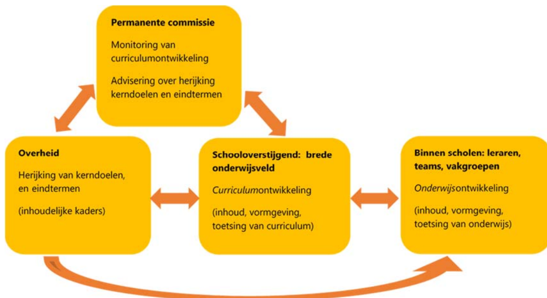
Figuur 2. Schematische weergave van de permanente commissie binnen curriculumvernieuwing

De Onderwijsraad ziet voor de permanente commissie twee taken weggelegd: 1) adviseren over het periodiek herijken van kerndoelen en eindtermen; en 2) monitoren van curriculumontwikkelingen en hun samenhang. In figuur 2 is dit afgebeeld. De commissie heeft nadrukkelijk niet tot taak de inhoud en vormgeving van het onderwijs op scholen te bepalen, vast te stellen, te beoordelen of te toetsen. De onafhankelijkheid van de permanente commissie dient tot uiting gebracht te worden door zijn taakstelling wettelijk te verankeren en door een zekere, maar principiële afstand tot het ministerie van OCW en de politiek in te nemen. Dat brengt de commissie ook in een positie om tussentijdse, specifieke (ad-hoc)wensen omtrent nieuwe inhoud van het curriculum te wegen in de context van het totale curriculum. Op die manier kan de commissie de samenhang tussen inhoud bewaken en voorkomen dat het curriculum wordt overladen met doelen.