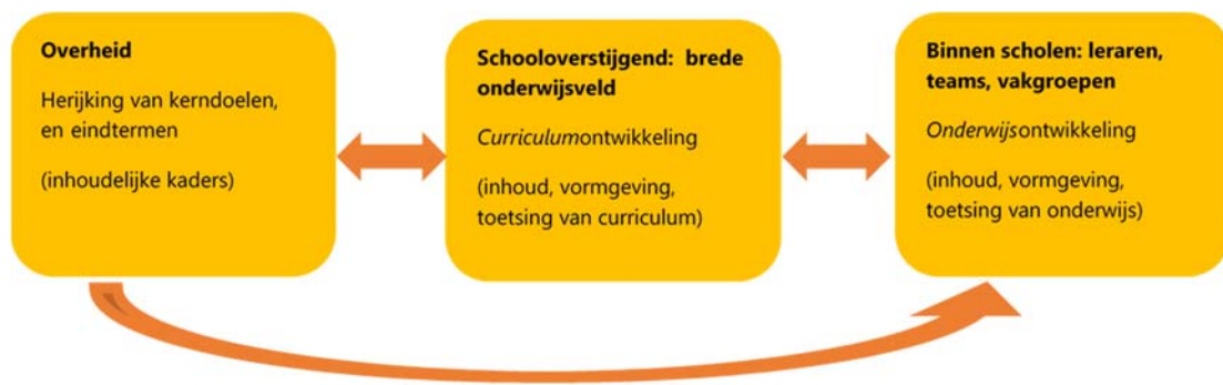
Figuur 1. Schematische weergave van processen binnen curriculumvernieuwing

Curriculumvernieuwing betreft volgens de raad drie verschillende processen, namelijk 1) het herijken van kerndoelen en eindtermen; 2) curriculumontwikkeling; en 3) onderwijsontwikkeling. Figuur 1 geeft deze verschillende processen (en het niveau van het onderwijssysteem waarop deze plaats moeten vinden) schematisch weer. De pijlen in de figuur geven de voeding aan die nodig is voor herijking en ontwikkeling. De figuur geeft noch fases weer (de processen lopen gelijktijdig en in wisselwerking met elkaar) noch hiërarchie (in de zin van mate van belangrijkheid). Hieronder worden de verschillende processen nader toegelicht.